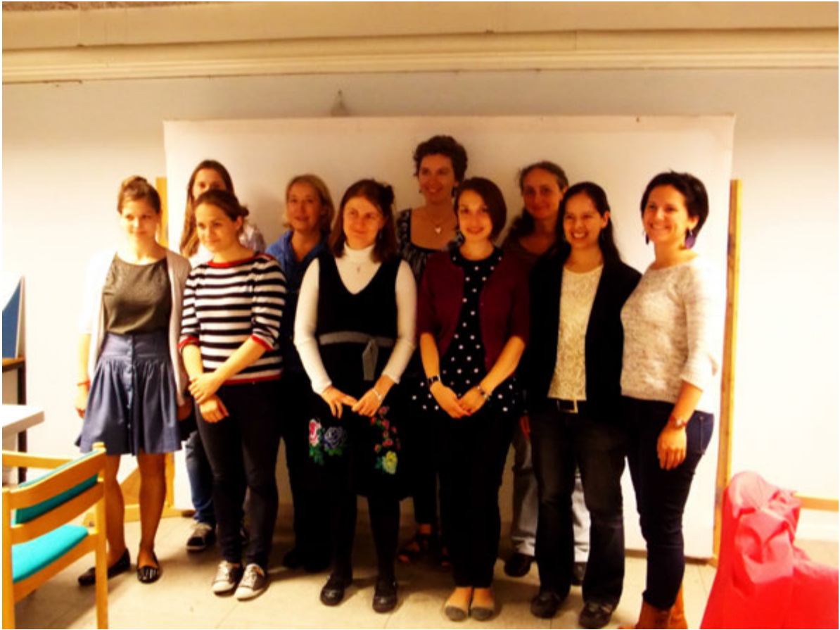
Alle pigerne der deltog i Bornholm WIM